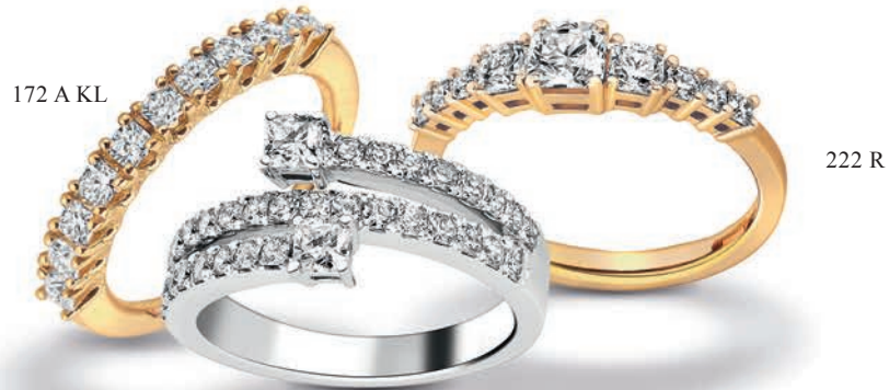
172 A KL